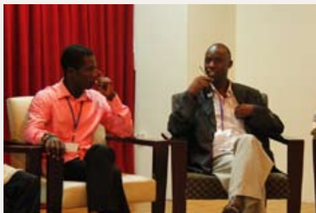
來自坦尚尼亞的 Super於論壇中，分享著清大國際志工對於當地的影響。

即便雙向交流的活動只有短短五天，清華大學國際志工團與尼泊爾、印尼、迦納、坦尚尼亞的合作情誼卻是超越時間與空間的，雙方也透過這五天的交流，探索並思考國際服務的涵義與更深入的合作模式。