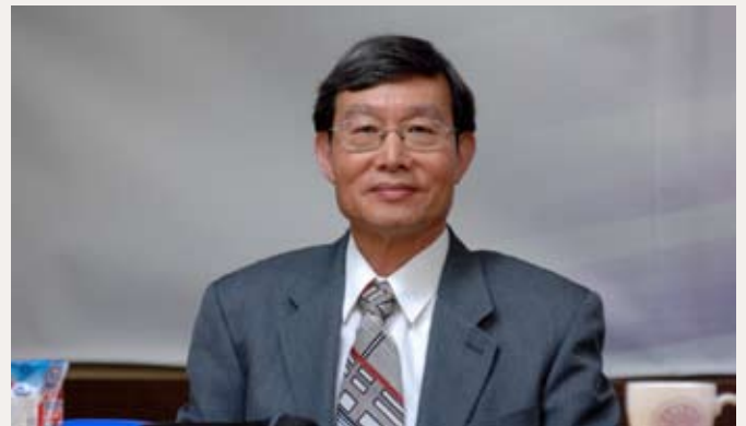
張石麟院士以傑出貢獻獲頒2011年「發展中世界科學院」院士。

開發國家的科學組織的著名科學家中選舉產生約50名新的院士。華人的院士為數眾多，兩岸及海外華人即佔20%左右。2011年台灣有張石麟、張文昌、李遠鵬及陳培哲四位中央研究院院士獲得此國際榮耀。