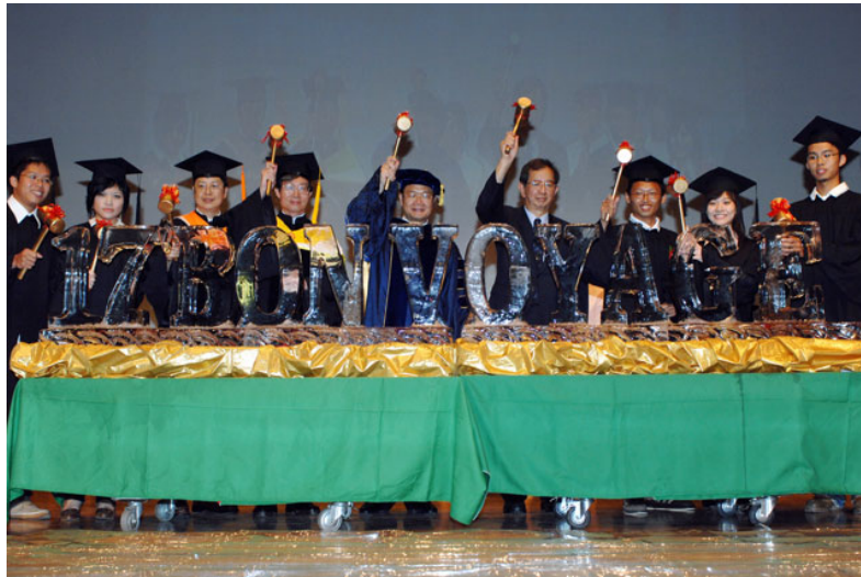
《17 學系破冰揚帆 展翅高飛》