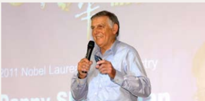
丹·謝特曼博士以「準周期晶體的發現」進行專題演講。