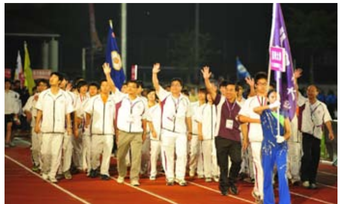
葉副校長帶領清華運動健兒進場。