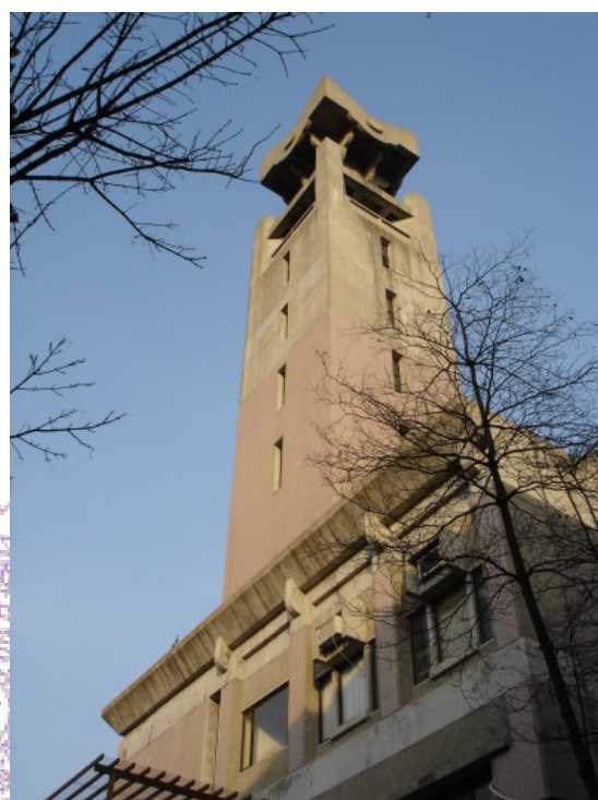
林繼遠 --- 人社鐘塔