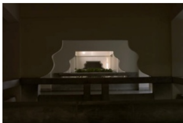
張子軒 --- 層次