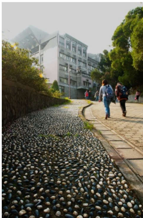
洪明郁 --- 上課去