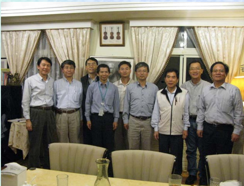
2009/11/27 81~84 級系友餐敘