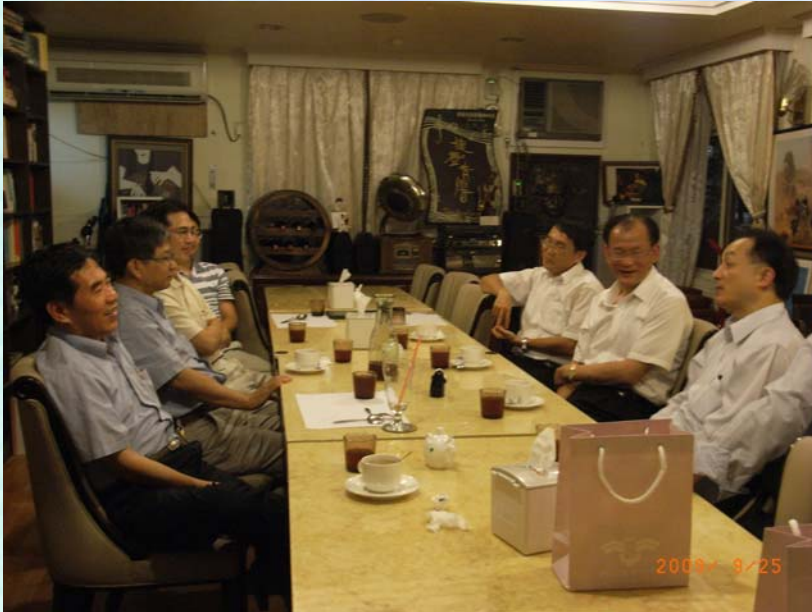
2009/9/25 76~79 級系友餐敘