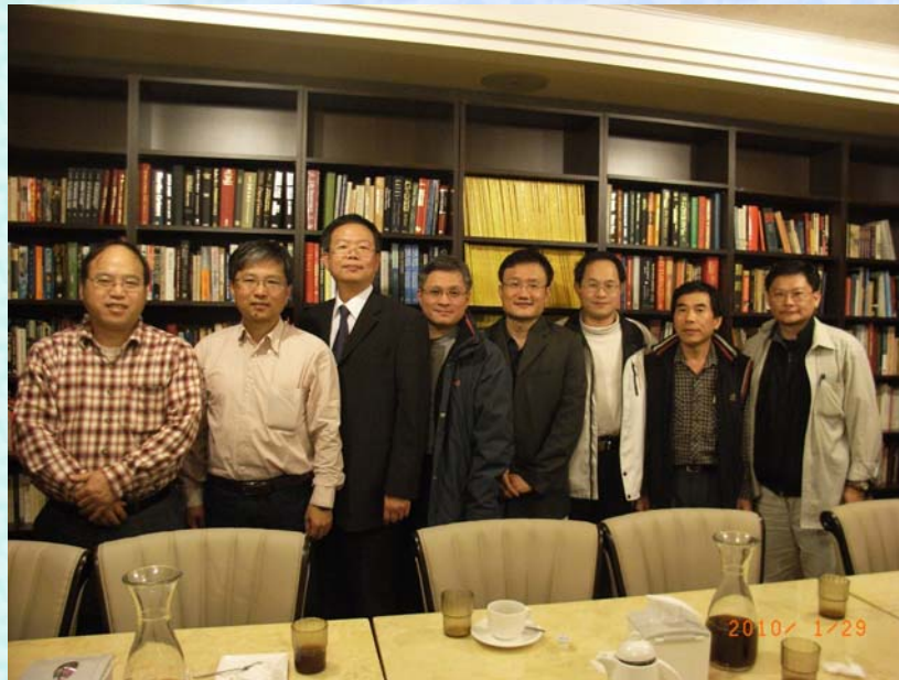
2010/1/29 85~88 級系友餐敘